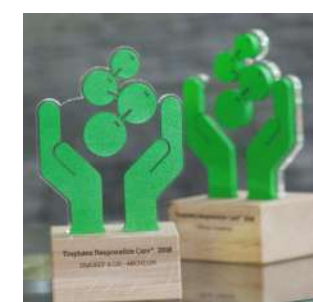
Chaque année, les trophées Responsible Care récompensent vos réalisations RSE

Il est accompagné d'un nouvel outil d'autoévaluation simple d'utilisation permettant de visualiser les actions prioritaires à mettre en œuvre dans le cadre de la démarche RSE et d'aider à la prise de décision.